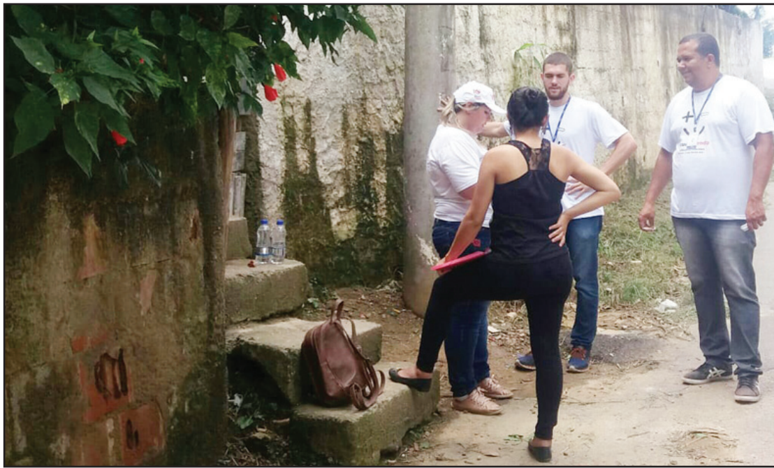
Moradores são orientados sobre a Dengue e a vacinação contra a Febre Amarela

• Agentes de Endemias reforçam os trabalhos de orientação e eliminação de criadouros do mosquito