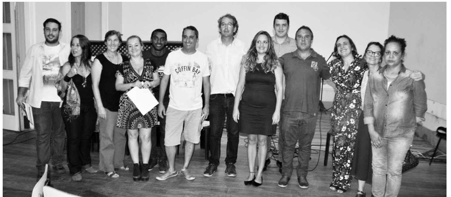
Equipe da Secretaria de Estado de Cultura com os delegados eleitos