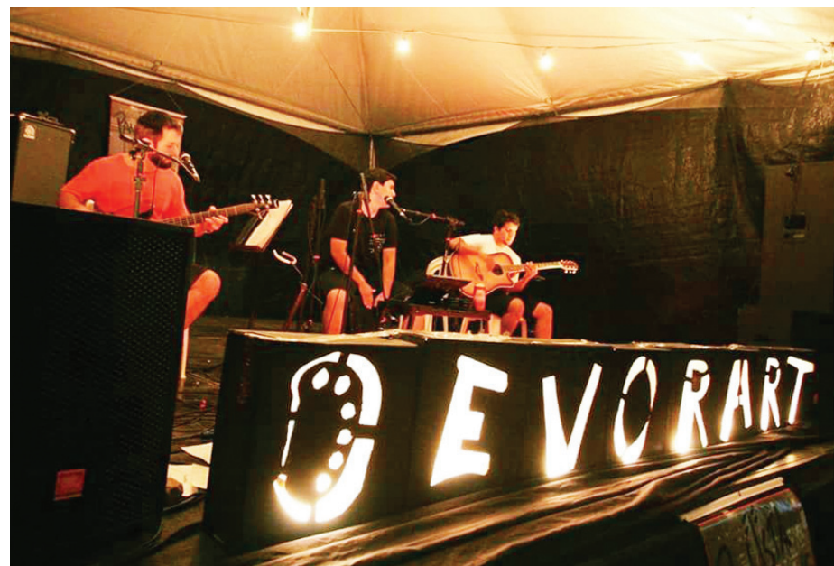
As bandas Alecrim e PMPO foram atrações locais durante a segunda edição do Devorart