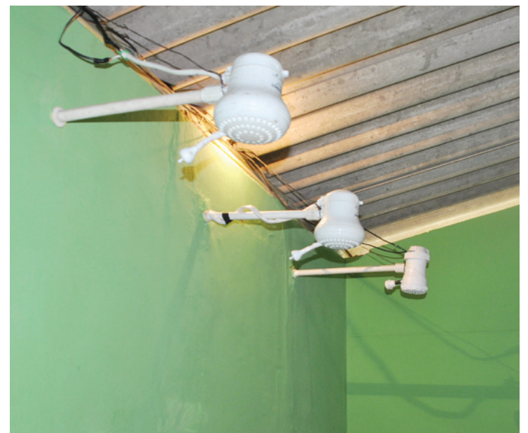
Os vestiários foram reformados e ganharam chuveiros elétricos