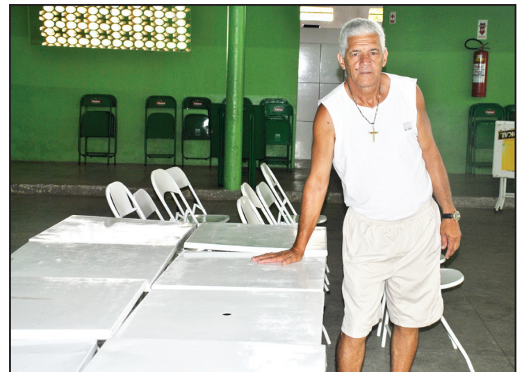
Todas as mesas e cadeiras do XV foram reformadas