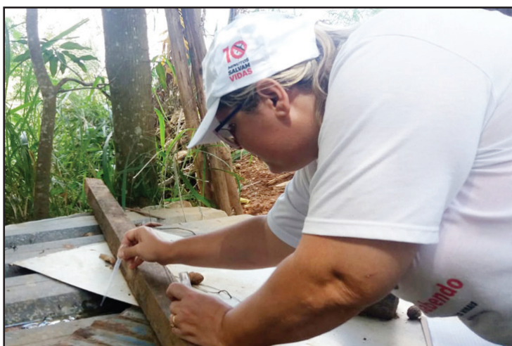
Os agentes de Endemias recolhem material para análise durante as visitas domiciliares

Durante as visitas domiciliares, os Agentes de Endemias reforçam o trabalho de orientação e conscientização com os moradores e recolhem material para análise em locais de possíveis criadouros do mosquito Aedes aegypti . Durante a abordagem, os agentes também orientam os moradores sobre a vacinação contra a Febre Amarela, que continua sendo ofertada em