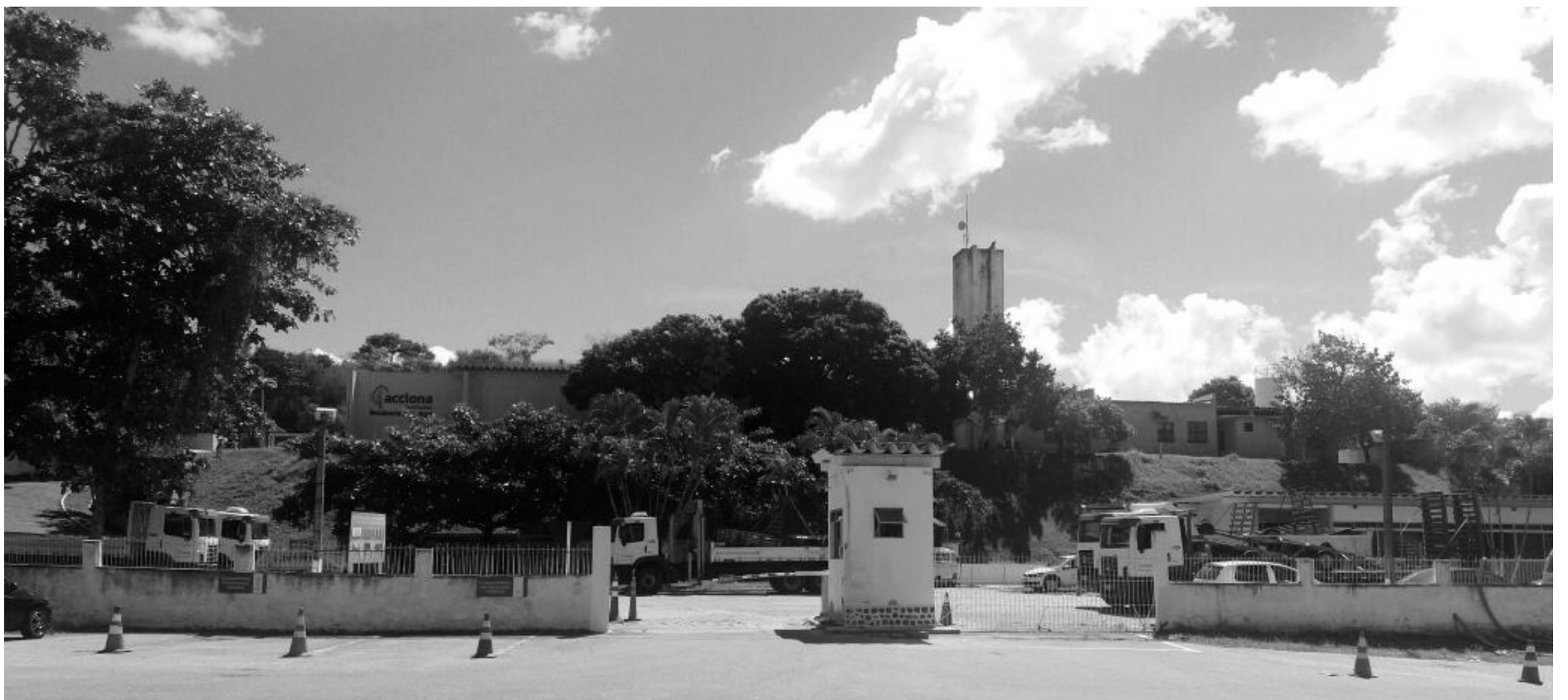
A notícia trouxe apreensão a Vassouras, que sedia o escritório da empresa na região

A Acciona é a terceira concessionária que tenta devolver rodovias licitadas ao controle do governo federal. O presidente Michel Temer chegou a enviar uma Medida Provisória ao Congresso tratando da relicitação de concessões. A MP, no entanto, não encontrou apoio nem na base governista, não foi à votação e já perdeu a validade. Pelo contrato de licitação, a Acciona administraria a rodovia até 2033.