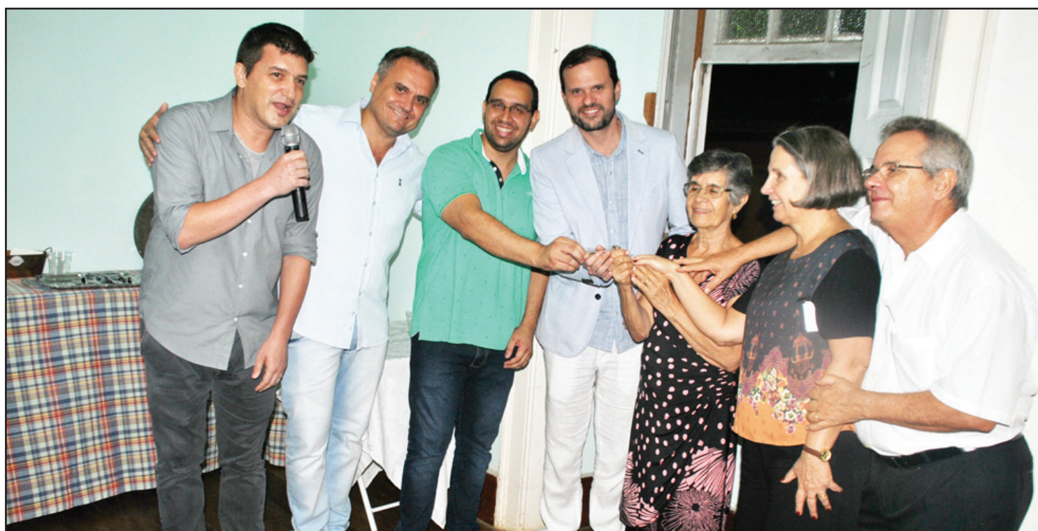
“A família PIM” recebendo as chaves do solar Barão de Massambará das mãos do sub-secretário Léo Feijó

Em dia de oficialização da casa nova, o Programa Integração Pela Música (PIM) sediou na sexta-feira, dia 6, no Solar do Barão de Massambará,