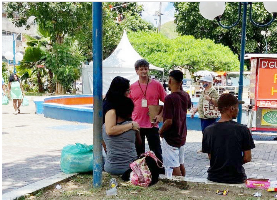
Profissionais da Assistência Social promoveram ações de amparo às pessoas em situação de rua

A Secretaria de Assistência Social da Prefeitura de Barra do Piraí promoveu mais uma ação com a população em situação de rua no município. O evento aconteceu na Praça Nilo Peçanha, no Centro, na manhã desta quarta, 20, em parceria com a Secretaria de Saúde e com órgãos do Governo do Estado, como o Leão XIII e o Centro de Cidadania LGBTI+.