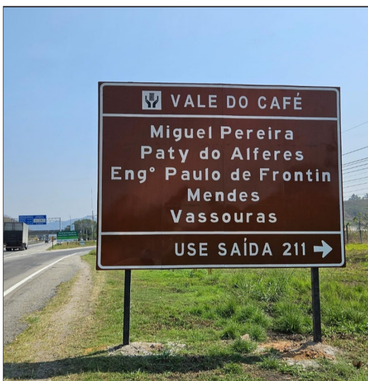
Placas de Sinalização turística instaladas na Dutra e na BR 393

- Festival de Gastronomia delicias do Vale que aconteceu em junho em Pirai e também nos restaurantes, hotéis