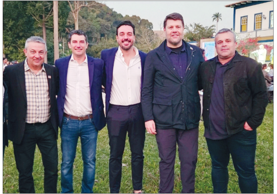
Fazenda Floresta é destaque no Festival Vale do Café