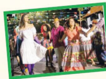
19H APRESENTAÇÃO DA QUADRILHA DA PIMZADA

PIM Arraiá da PIMzada III e 24 anos do PIM!