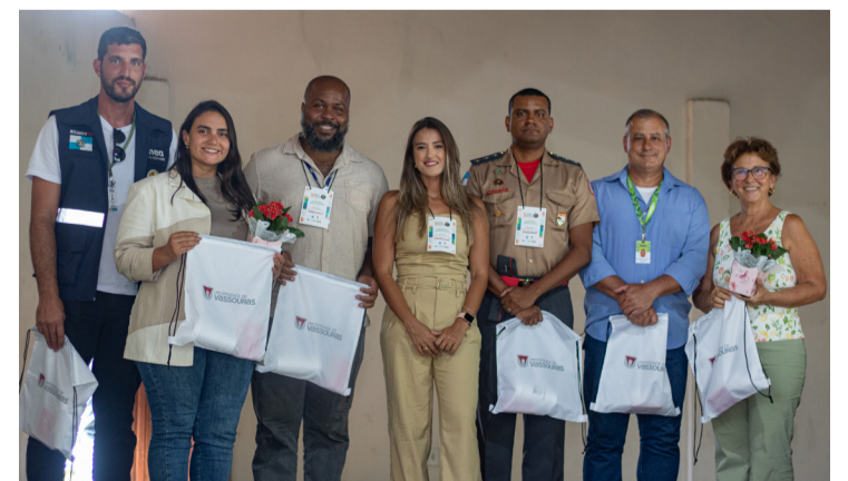
Grupos de trabalho apresentaram propostas que serão encaminhadas para a conferência estadual