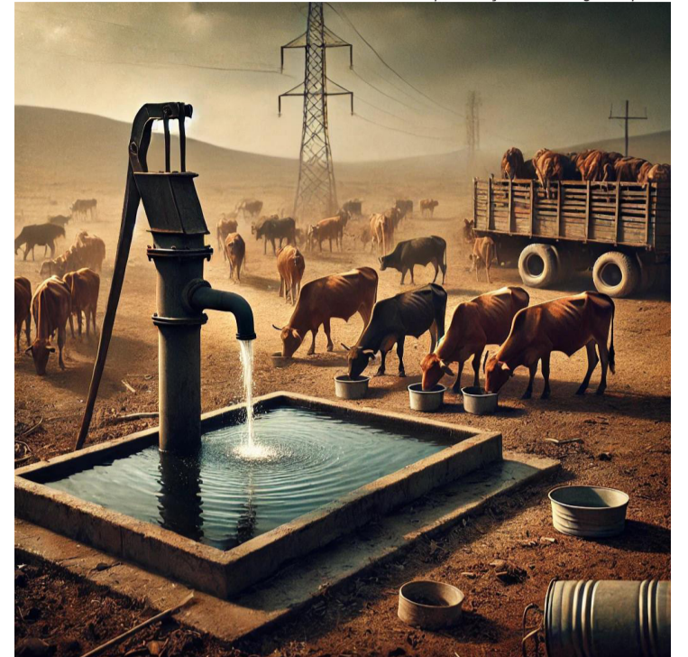
Representação ilustrativa gerada por IA

luz são os hoteleiros, que recorrem ao uso constante de geradores, com custos elevados.