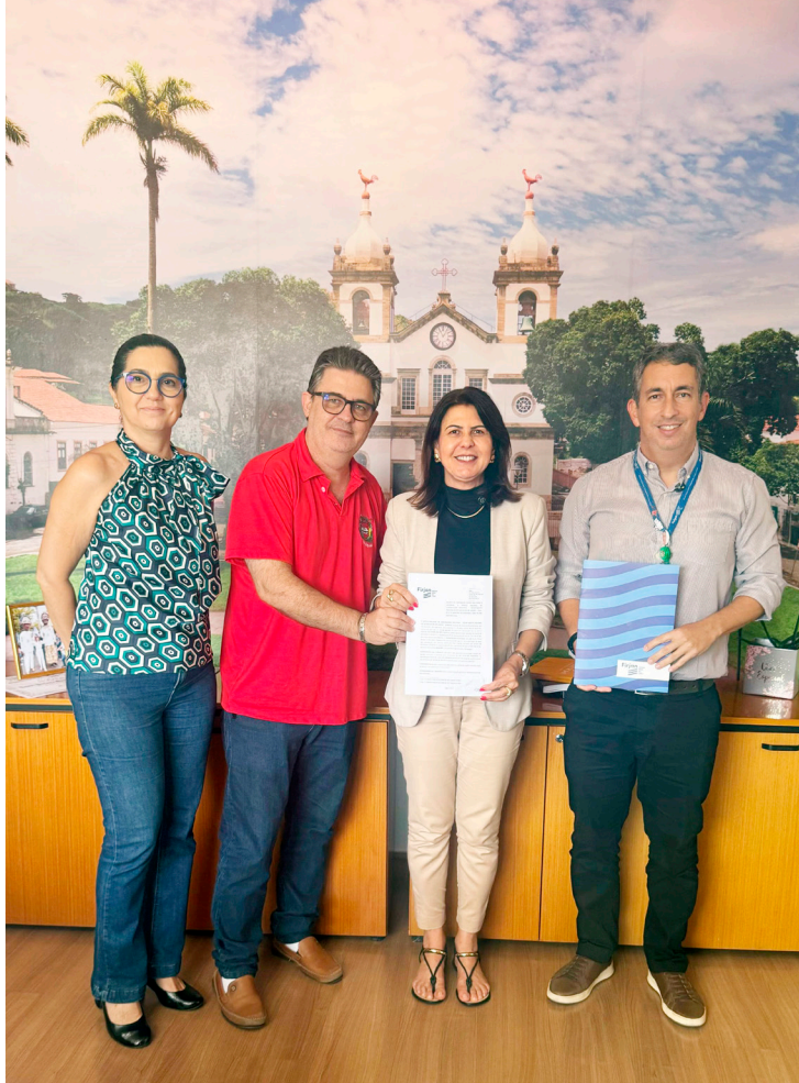
Vassouras renova acordo técnico com a Firjan para ofertar cursos gratuitos de qualificação profissional

“Os cursos são uma parceria com a Firjan|Senai e faz parte do nosso planejamento em oferecer oportunidades de qualificação profissional para a população. Ter uma certificação da Firjan traz